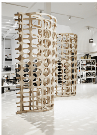
SATURATED POROSITY - FREESTANDING SCREEN AF ANNE ROMME