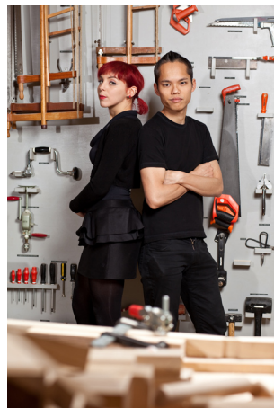
LANZAVECCHIA + WAI PORTRÆT

PRESSEMATERIALE KAN HENTES PÅ WWW.TIMETODESIGN.EU