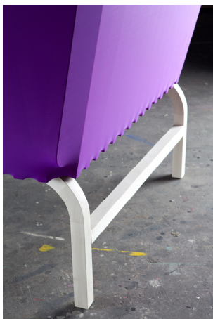
SPAZIALE SERIES AF LANZAVECCHIA + WAI OUR, DETALJE FRA STOL