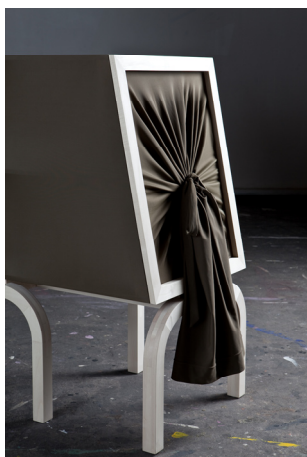
SPAZIALE SERIES BY WAI & LANZAVECCHIA COMMODE DETAIL